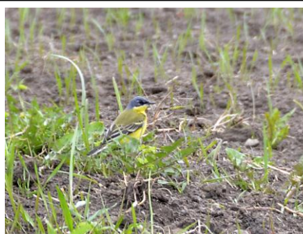
Hanne av nordlig gulärta, Landsjön

Därefter blev vi lotsade till Tranebo vid norra delen av Dumme Mosse. Från det (mer anspråkslösa) tornet där har man god utsikt, även om själva mosseplanet är rätt skymt av trädridåer. Det var för övrigt helt i närheten av denna plats som den bejublade svartvingade gladan höll till några apriildagar 2012. Här såg vi några tranpar, sångsvanar och en buskskvätta hördes sjunga. Höjdpunkten där (förutom förmiddagsfikat!) var ett par smålommar som kacklande flög ett par rundor. Dessa häckar i mossen men flyger till mer fiskrika vatten för att fiska. Livskryss för några av deltagarna!